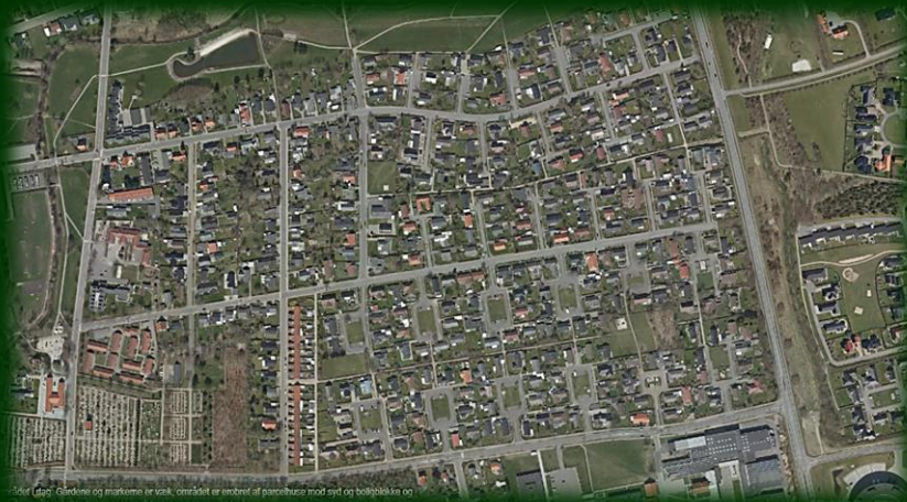
Skjern-bebyggelse, Ringkøbing-Skjern Kommune 2017

Tag for eksempel Ringkøbing-Skjern Kommune med sine mange boligejere. De kan nu se frem til en langt mere tryk fremtid. Det, synes jeg bestemt, er på sin plads, fordi for mange mennesker er netop købet af bolig den største investering, man gør sig gennem livet. Derfor skal der være fuldkommen tryk i købet af bolig, det giver ro, og det giver familierne en afklaring, som jeg synes, de skal have.