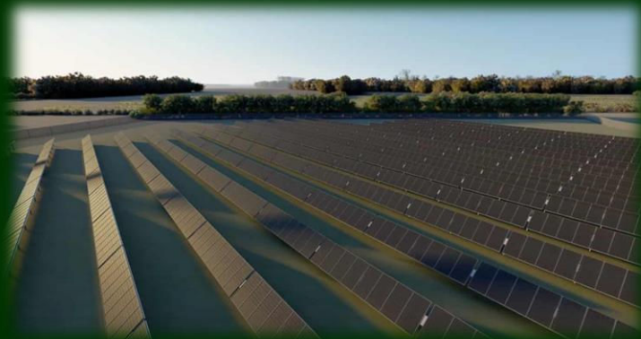
Illustration GreenGo Energy

Heldigvis føles det som om, der i byrådet er større accept af øget lokal medindflydelse og medbestemmelse - samtidig med, at der arbejdes med nye muligheder for mere lokalt ejerskab. Så der er efter min mening grundlag for optimisme fremover.