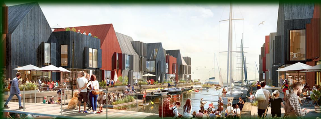
Raunonia foreløbig projektskitse

RAUNONIA: Et ret stort flertal i byrådet vedtog på byrådsmødet i oktober, at man, når der kommer henvendelse fra en eller flere interesserede projektmagere, vil sætte området ved Toftens parkeringsplads og området foran rådhuset til salg i offentlig udbud, såfremt projektmagere opnår tilladelse til opfyldning af området i fjorden ud for rådhuset og havnen til Rauonia-projektet.