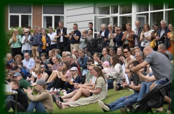
Den 12. juni 2022 fejrede FASTER Sogn i Ringkøbing Skjern Kommune Landsbyprisen 2022.

Tidligere har Landsbyprisen primært været baseret på opnåede resultater i de enkelte lokalområder. Den nye proces skal bl.a. sikre, at der kommer mere fokus på tilgangen til udvikling og det fremadrettede potentiale. Det er et perspektiv, flere har efterlyst i evalueringen. Derudover indstiftes en helt ny pris – Initiativprisen på 25.000 kroner. Den gives til en ansøger, der har gjort en særlig bemærkelsesværdig indsats.