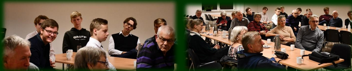
...så det blev en rigtig livlig debat, hvor man nåede vidt omkring i det politiske landskab!

- Kort sagt en rigtig spændende og hyggelig aften i vælgerforeningen med masser af hyggeligt samvær og udbytterig politisk dialog, og som forhåbentlig fortsat vil være en fast tradition!