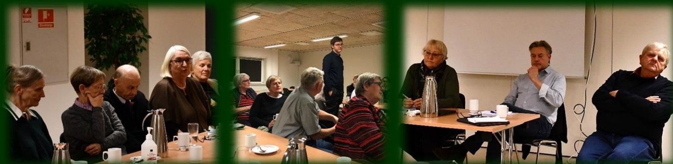
Der kom rigtig mange gode spørgsmål og synspunkter, som byrådsmedlemmerne veloplagte kommenterede og forholdt sig til...

Herefter var ordet frit, og det viste sig hurtigt, at både lysten til at tage ordet, stille kritiske spørgsmål, komme med forslag og i øvrigt sige sin mening bestemt ikke fejlede noget. Der var således bl.a. spørgsmål og synspunkter i relation til situationen omkring Karup Lufthavn, om Ringkøbing-Skjern Kulturcenters økonomiske problemer, Ringkøbing-Skjern Forsyning og placeringen af rensningsanlæg i Tarm, ligesom også Raunonia-projektet i Ringkøbing, køkkenet Åkanden i Tarm, lang ventetid i psykiatrien, placering af højhuse i kommunen og fremtidige energiparker såvel som ønsker om øget udlicitering var emner, der diskuteredes.