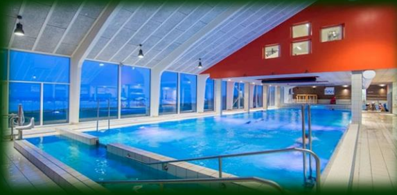
Ringkøbing Svømmehal.

I Kultur- og fritidsudvalget er en af udfordringerne den store stigning i udgifterne til energi i vores haller. Specielt vores svømmehaller kæmper med de store omkostninger, så det ser nogle steder ret sort ud med økonomien. Ingen kan vel forestille sig en lukket svømmehal, men løsningerne ligger ikke lige foran os. Pengene skal jo komme et sted fra, og de må findes. Som kommune er vi forpligtet til at holde disse haller åbne for børn og voksne.