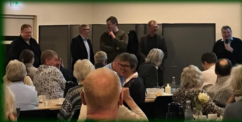
Den nyvalgte bestyrelse i Storkredsen