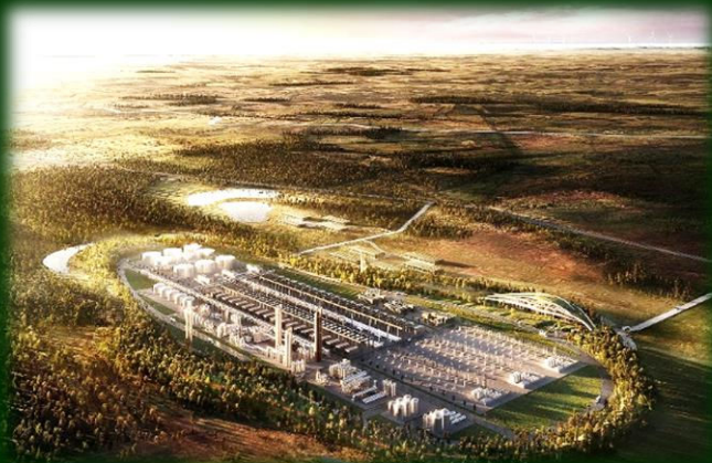
Visualisering: GreenGo Energy

Der er nu ansøgt formelt – dog alene som konceptansøgning - om igangsætning af undersøgelser, der kan føre til projektets gennemførelse.