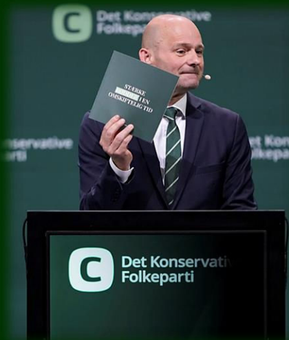
Søren Pape præsenterer "Stærke rødder i en omskiftelig tid"

Søren Pape Poulsens tale ventede jeg på med spænding. Det har ikke været et godt år for Det Konservative Folkeparti – og Søren har set slidt ud. Det forstår jeg godt. Inden talen kom han og hilste på ved vores bord. Han så heldigvis atter frisk ud, og da han gik på talerstolen, blev talen leveret overbevisende – som jeg kender ham, når han er bedst.