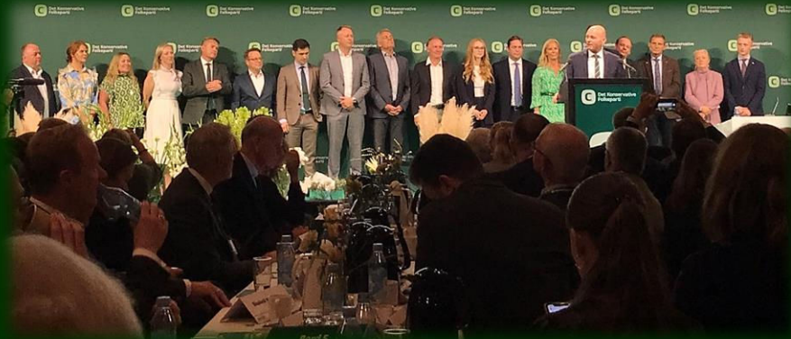
De nyvalgte konservative EP-kandidater