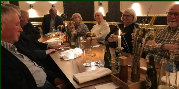
Samling om julefrokost – god julemad og socialt samvær