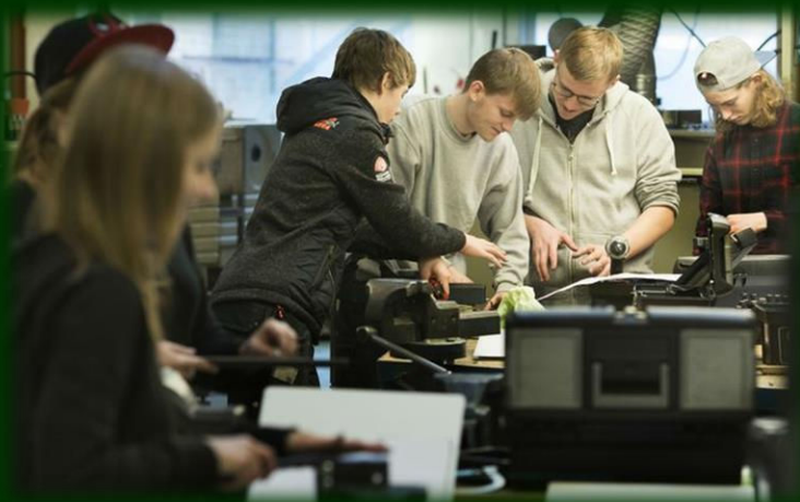
Industri teknikerne fra Learnmark i Horsens.

Målet er at få skabt en ny fortælling om erhvervsskolerne og dermed sikre, at flere unge får øjnene op for de mange muligheder en erhvervsuddannelse giver.