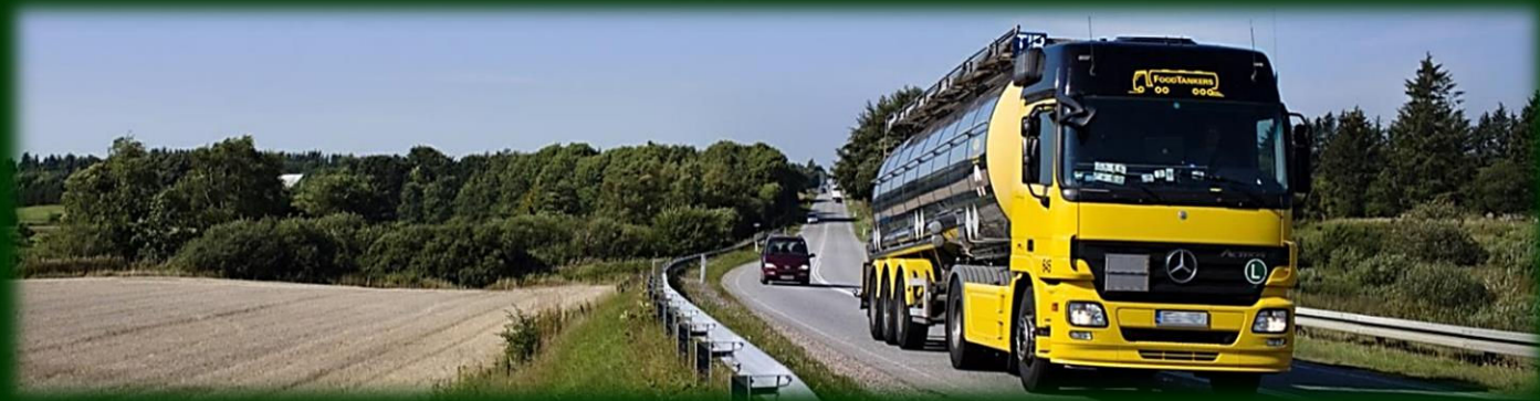
Illustration: Vejdirektoratet nov. 2023

Der er også andre forbindelser, der ikke endelig er på plads. Det forventes, at arbejdet påbegyndes i 2024.